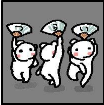
こまっちんぐ隊(3人) また明日。